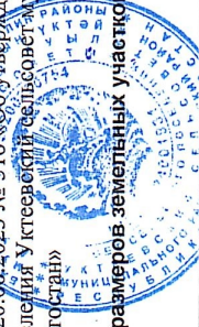
Таблица № 5 Градостроительные регламенты использования территории в части предельных (максимальных и(или) минимальных) размеров земельных участков и предельных параметров разрешенного строительства, реконструкции объектов капитального строительства

к решению Совета сельского поселения Уктеевский сельсовет муниципального района Иглинский район Республики Башкортостан от « 21 » 10 10 г. № 133 133 «О внесении изменений в решение Совета сельского поселения Уктеевский сельсовет муниципального района Иглинский район от 20.06.2023 № 516 «Об утверждении правил землепользования и застройки сельского поселения Уктеевский сельсовет муниципального района Иглинский район Республики Башкортостан»